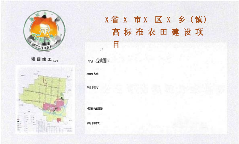
高标准农田建设项目公示牌