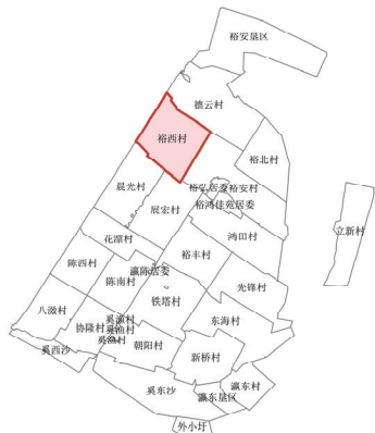
陈家镇区位索引图