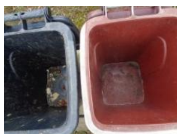
华荣村建城 220 号垃圾分类正常