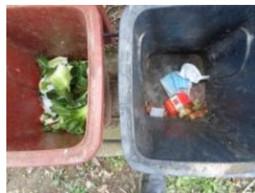
华星村海桥 1009 号垃圾分类正常