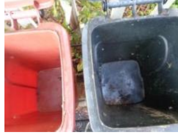
海华新村 54 号垃圾分类正常