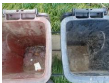
绿港村建闸 301 号垃圾分类正常