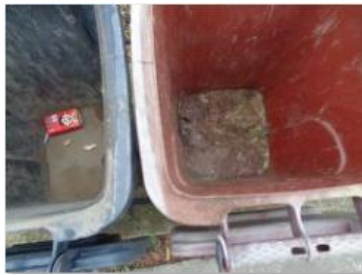
绿湖村湖滨 516 号垃圾分类正常