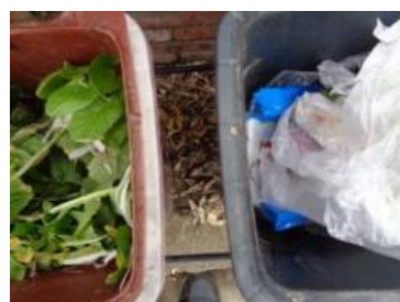
华西村建桥 1046 号垃圾分类正常