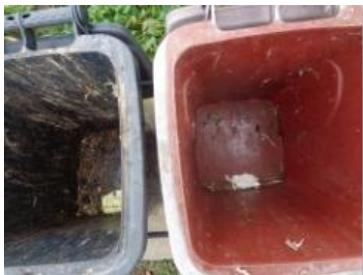
华荣村建城 105 号垃圾分类正常