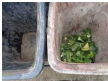
华星村海桥 1010 号垃圾分类正常