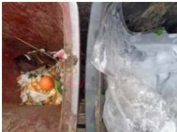
华星村海桥 1004 号垃圾干湿不分