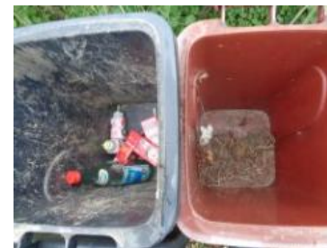
绿湖村湖滨 517 号垃圾分类正常