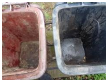
华星村海桥 1006 号垃圾分类正常