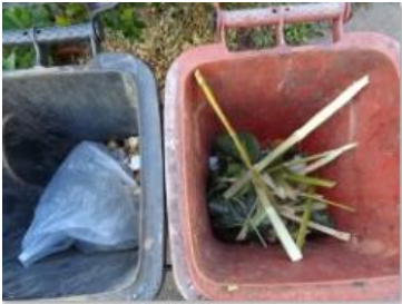
海华新村 45 号垃圾分类正常