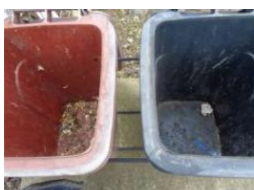
绿港村建闸 106 号垃圾分类正常