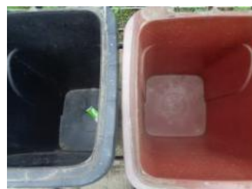
绿港村建闸 111 号垃圾分类正常