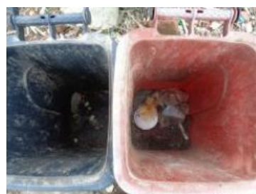
绿园村建新 21 号垃圾干湿不分