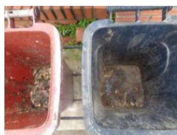
华西村建桥 1065 号垃圾分类正常