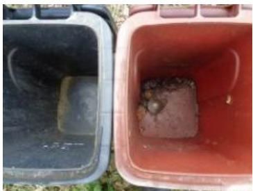
绿园村建新 29 号有害垃圾混投