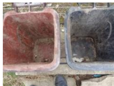
华荣村建城 219 号垃圾分类正常