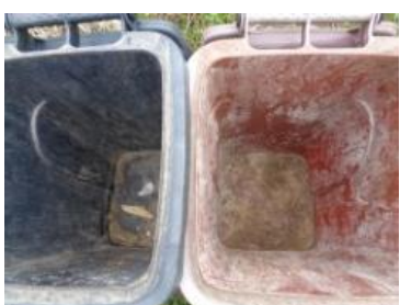
绿园村海桥 707 号垃圾分类正常