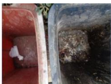
华荣村建城 221 号垃圾干湿不分