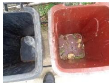
华荣村建城 222 号垃圾分类正常