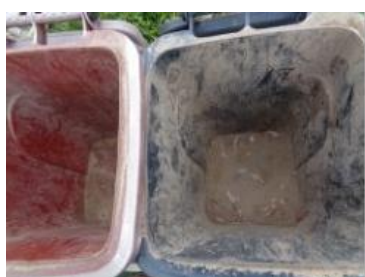
绿园村海桥 709 号垃圾分类正常