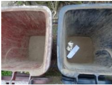
绿湖村湖滨 605 号垃圾分类正常