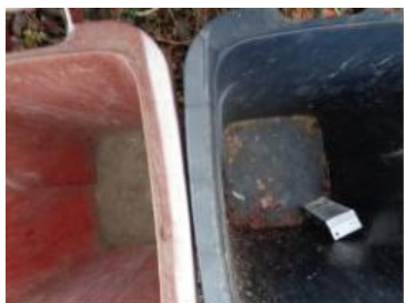
华西村建桥 1022 号垃圾分类正常