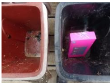
华西村建桥 1032 号垃圾分类正常