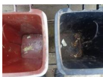
绿港村建闸 104 号垃圾分类正常