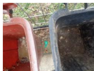
华西村建桥 1051 号垃圾分类正常