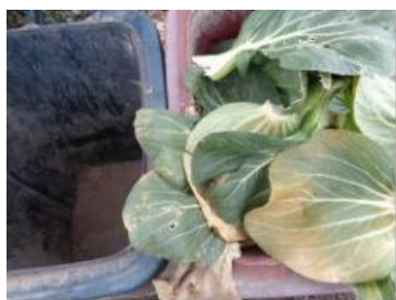
华星村海桥 1002 号垃圾分类正常