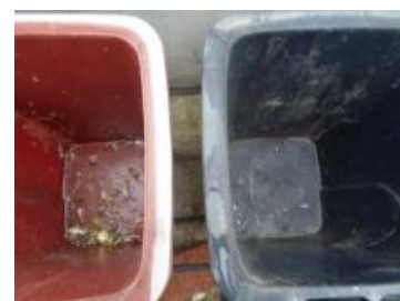
绿港村建闸 131 号垃圾分类正常