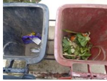
绿湖村湖滨 801 号垃圾分类正常