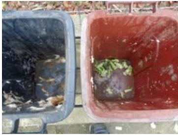
绿湖村湖滨 902 号垃圾分类正常