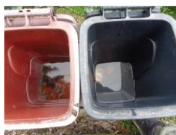
绿园村海桥 708 号垃圾分类正常