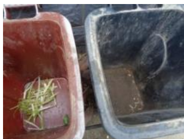
华星村海桥 1005 号垃圾分类正常