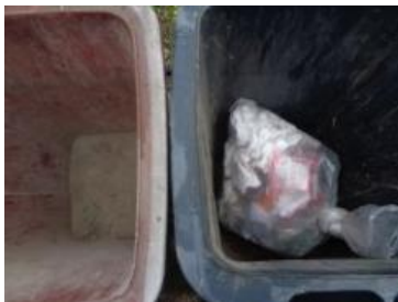
绿湖村湖滨 603 号垃圾分类正常