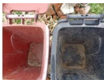
绿园村海桥 706 号垃圾分类正常