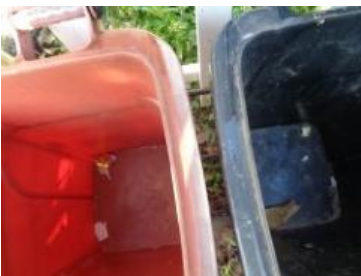
海华新村 55 号垃圾分类正常