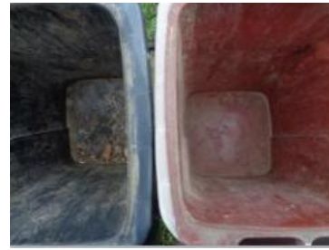
绿湖村湖滨 604 号垃圾分类正常