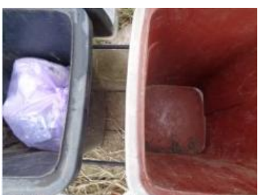
华荣村建城 409 号垃圾分类正常