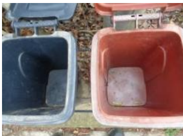
绿港村建闸 303 号垃圾分类正常