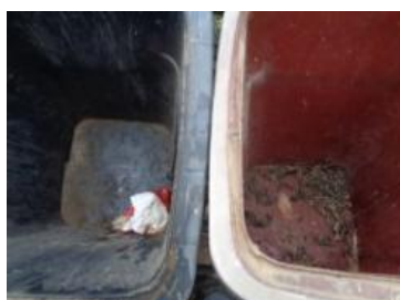
绿港村建闸 304 号垃圾分类正常