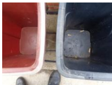
华西村建桥 1081 号垃圾分类正常