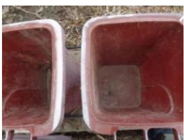
绿园村海桥 705 号垃圾分类正常