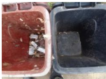
绿园村建新 22 号垃圾干湿不分