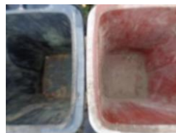
华荣村建城 408 号垃圾分类正常