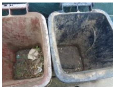
华星村海桥 1003 号垃圾分类正常