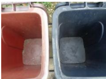
绿港村建闸 121 号垃圾分类正常