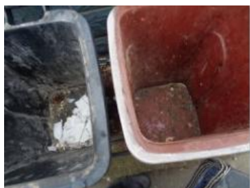
华星村海桥 1007 号垃圾分类正常