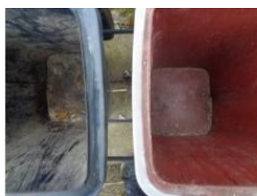
华荣村建城 309 号垃圾分类正常