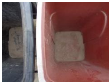
华西村建桥 1010 号垃圾分类正常