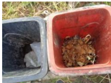
绿湖村竖河 507 号垃圾分类正常