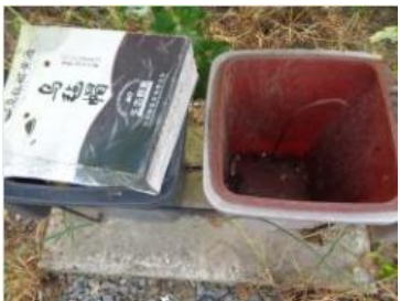
绿湖村竖河 528 垃圾分类正常