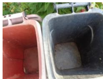
华西村建桥 507 号垃圾分类正常