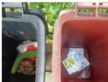
华星村海桥 206 号垃圾干湿不分