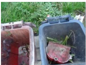
绿港村建闸 303 号垃圾分类正常