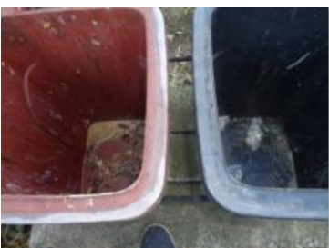
绿港村建闸 131 号垃圾分类正常