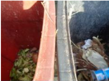
华星村海桥 214 号垃圾分类正常