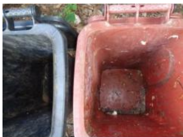
绿园村建新 701 号垃圾分类正常