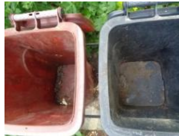
华荣村建城 503 号垃圾分类正常