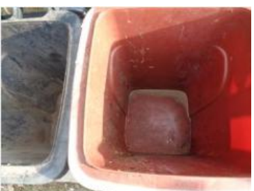
华西村建桥 506 号垃圾分类正常