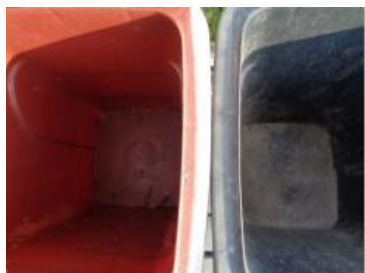
华西村建桥 521 号垃圾分类正常