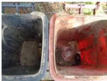
华荣村建城 502 号垃圾分类正常