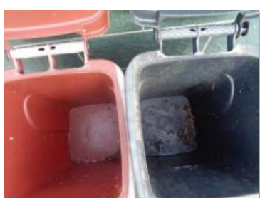
绿园村建新 711 号垃圾分类正常