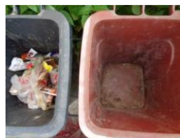
华西村建桥 509 号垃圾分类正常