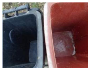
绿园村建新 709 号垃圾分类正常