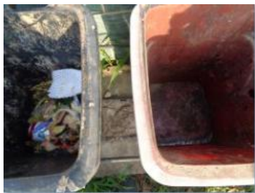
华星村海桥 207 号垃圾干湿不分