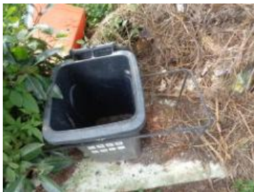
华荣村建城 518 号缺桶