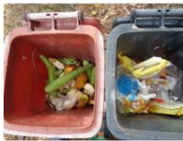
华荣村建城 508 号垃圾分类正常