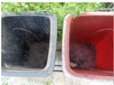
绿湖村竖河 511 号垃圾分类正常