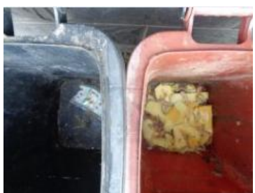
绿园村建新 705 号垃圾分类正常