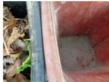
华星村海桥 212 号垃圾分类正常