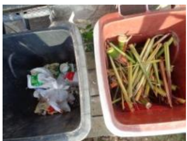
华西村建桥 528 号垃圾分类正常