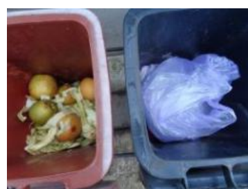
绿港村建闸 104 号垃圾分类正常