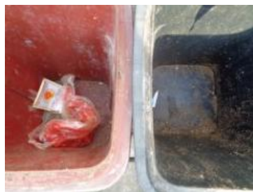
华星村海桥 208 号垃圾干湿不分