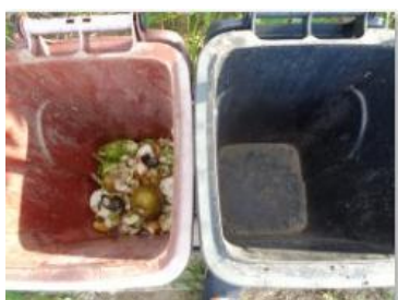
华西村建桥 508 号垃圾分类正常