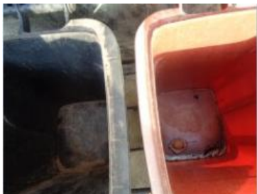
华星村海桥 211 号垃圾分类正常