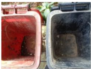
华荣村建城 402 号垃圾分类正常