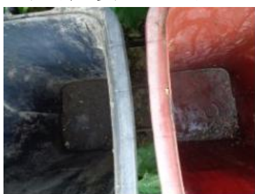
绿园村建新 706 号垃圾分类正常