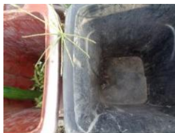
华西村建桥 503 号垃圾分类正常