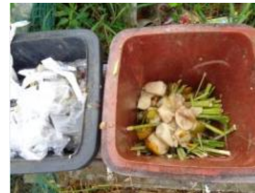
绿湖村竖河 503 号垃圾分类正常