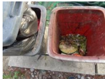
绿湖村竖河 504 号垃圾分类正常