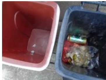
绿港村建闸 301 号垃圾干湿不分