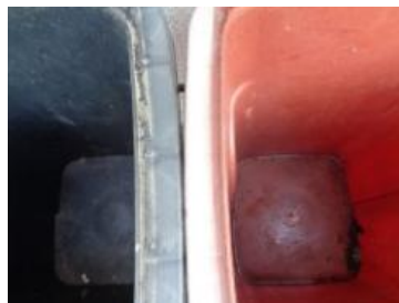
绿园村建新 708 号垃圾分类正常