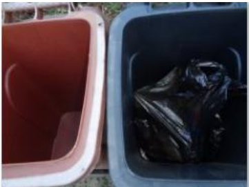
绿港村建闸 111 号垃圾分类正常