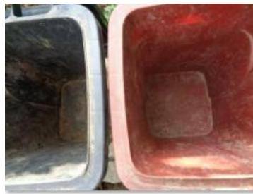
华荣村建城 403 号垃圾分类正确