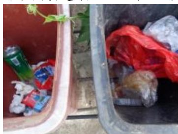
绿园村建新 703 号垃圾干湿不分