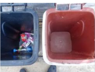
绿港村建闸 103 号垃圾分类正常