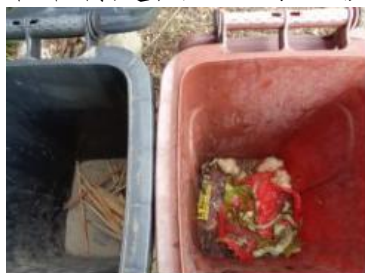
7、华荣村 2 处未分类投放、1 处缺桶 华荣村建城 404 号垃圾干湿不分