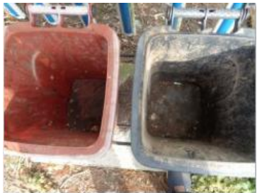
华荣村建城 501 号垃圾分类正常