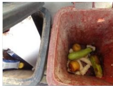
华星村海桥 210 号垃圾分类正常