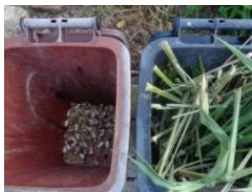
绿港村建闸 121 号垃圾分类正常