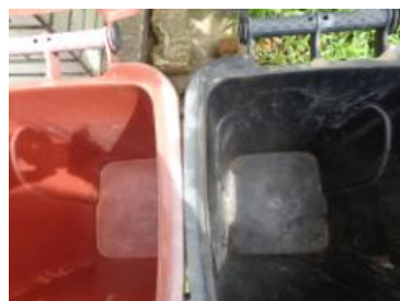
海华新村 55 号垃圾分类正常