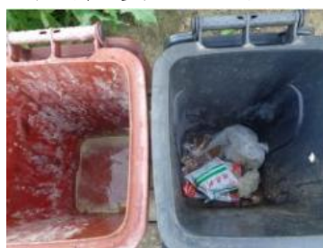
绿园村建新 710 号垃圾分类正常