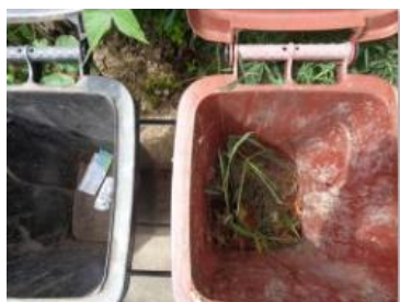
海华新村 53 号垃圾分类正常