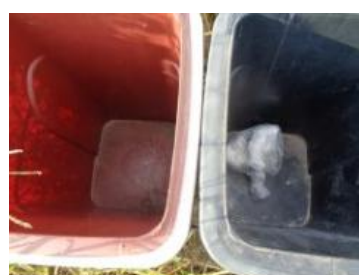
华西村建桥 505 号垃圾分类正常