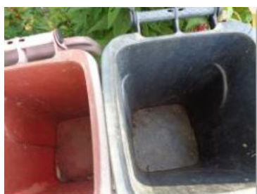
华西村建桥 539 号垃圾分类正常