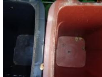
绿港村建闸 106 号垃圾分类正常