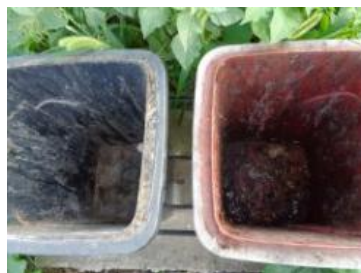
绿湖村竖河 549 号垃圾分类正常