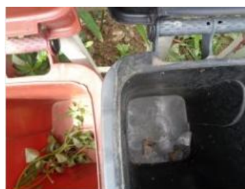
海华小区 54 号垃圾分类正常