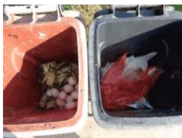
华荣村建城 301 号垃圾分类正常