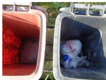
华西村建桥 528 号垃圾分类正常