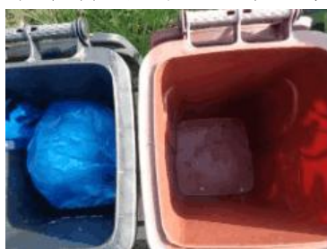
华荣村建城 205 号垃圾分类正常