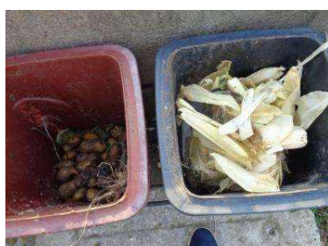
绿港村建闸 512 号垃圾干湿不分