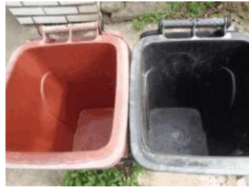
海华小区 54 号垃圾分类正常