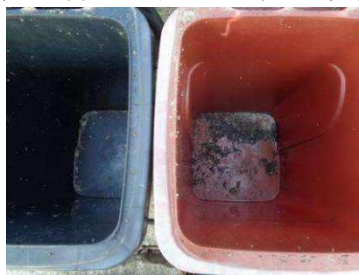
绿港村建闸 301 号垃圾分类正常