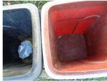
绿湖村竖河 504 号垃圾分类正常