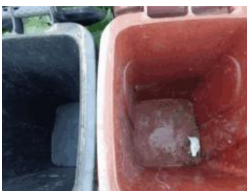
绿园村建新 705 号垃圾分类正常