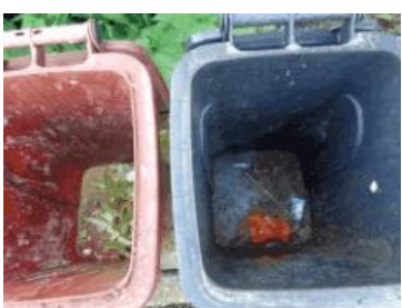
绿园村建新 709 号垃圾分类正常