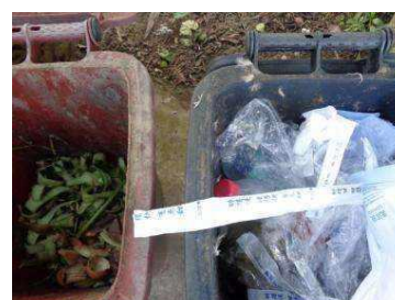
绿湖村竖河 503 号垃圾分类正常