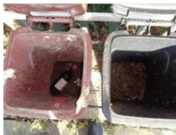
绿园村建新 713 号垃圾干湿不分