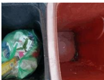
绿园村建新 707 号垃圾分类正常