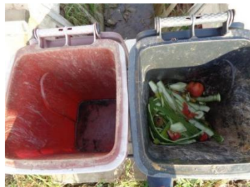
华星村海桥 101 号垃圾干湿不分