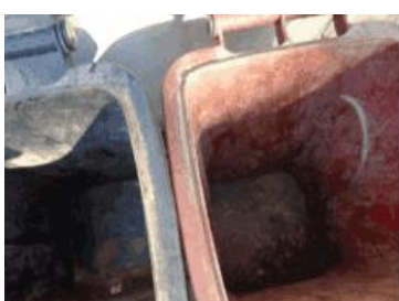
华星村海桥 102 号垃圾分类正常