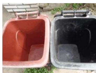
华荣村建城 204 号垃圾分类正确