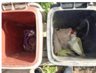
华荣村建城 403 号垃圾干湿不分