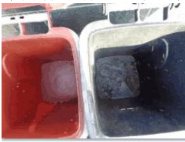
绿园村建新 711 号垃圾分类正常