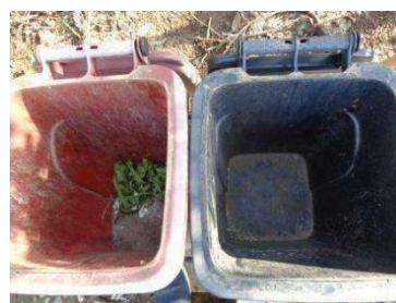
华西村建桥 505 号垃圾分类正常