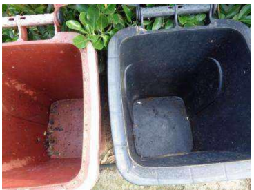
绿港村建闸 216 号垃圾分类正常