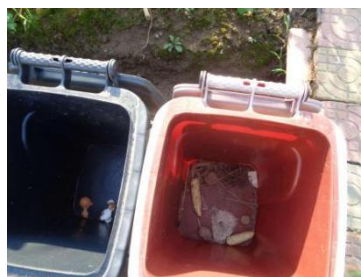
华星村海桥 112 号干湿不分