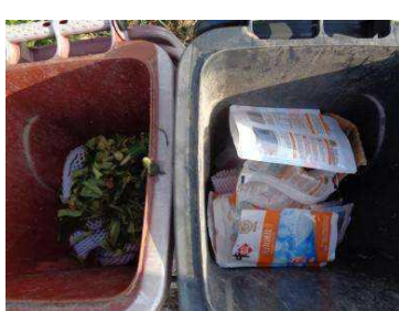
华西村建桥 503 号垃圾干湿不分