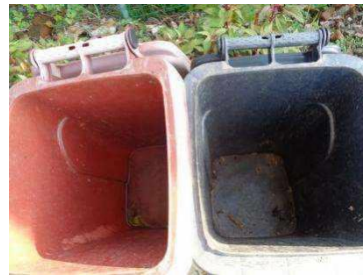
华西村建桥 521 号垃圾分类正常