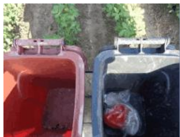
华荣村建城 206 号垃圾分类正常