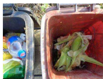
绿港村建闸 201 号垃圾分类正常