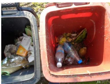
华星村海桥 111 号垃圾干湿不分