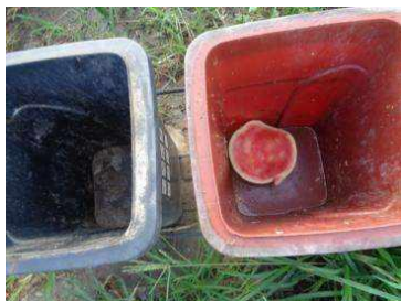
绿湖村竖河 507 号垃圾分类正常