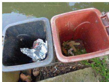
绿湖村竖河 341 号垃圾分类正常