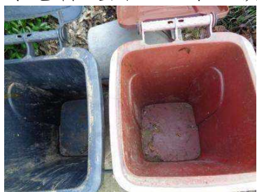
绿港村建闸 113 号垃圾分类正常