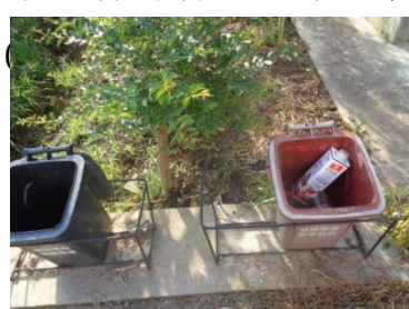
华星村海桥 106 号垃圾干湿不分