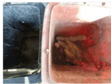
华星村海桥 105 号垃圾分类正常