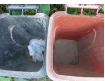
绿园村建新 710 号垃圾分类正常