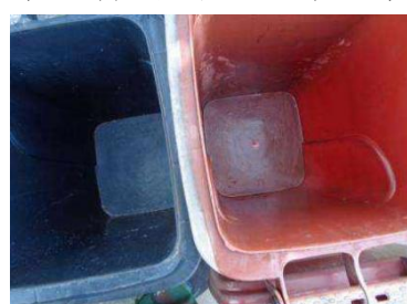
绿港村建闸 401 号垃圾分类正常