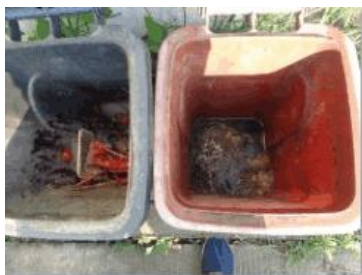
绿园村建新 706 号垃圾干湿不分