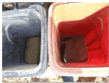
华荣村建城 306 号垃圾分类正常