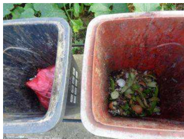
绿湖村竖河 549 号垃圾分类正常