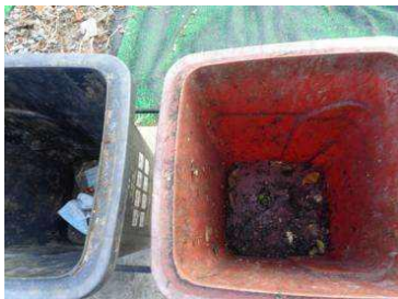
绿湖村竖河 528 号垃圾分类正常