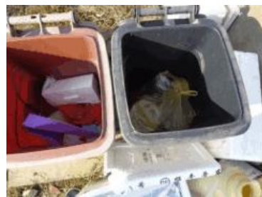
华荣村建城 402 号垃圾干湿不分