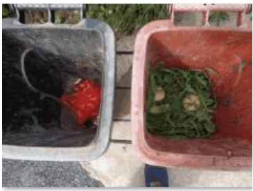
海华新村 55 号垃圾分类正常