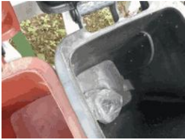
海华新村 45 号垃圾分类正常