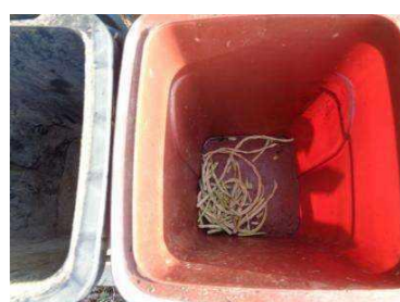
华西村建桥 506 号垃圾分类正常