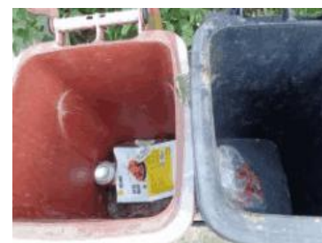
绿园村建新 703 号垃圾干湿不分