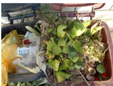
华星村海桥 104 号垃圾分类正常