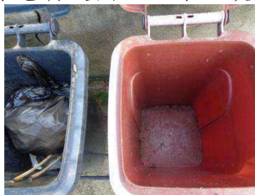
绿港村建闸 114 号垃圾分类正常