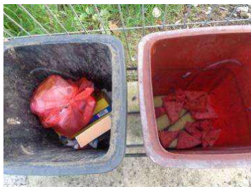
绿湖村竖河 511 号垃圾分类正常