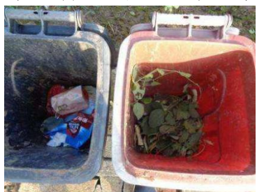
绿港村建闸 202 号垃圾分类正常