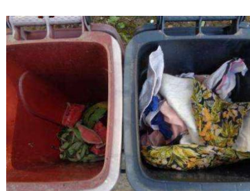
华西村建桥 507 号垃圾分类正常