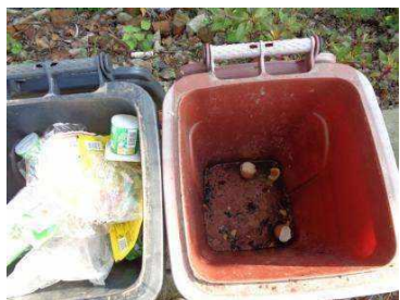
华西村建桥 536 号垃圾分类正常