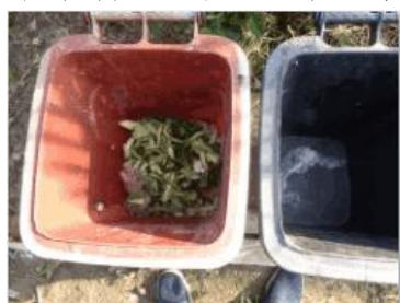
华荣村建城 401 号垃圾分类正常