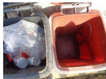
华西村建桥 508 号垃圾分类正常