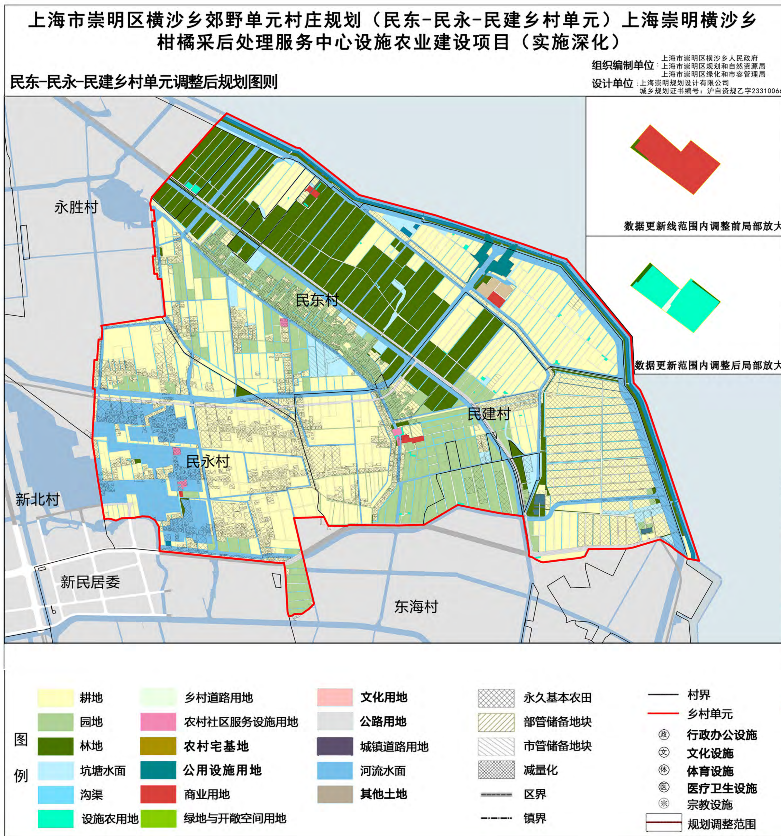
民东-民永-民建乡村单元调整后图则