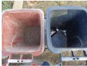
绿湖村湖滨 905 号垃圾分类正常