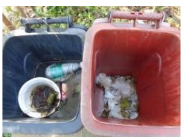
华星村海桥 206 号垃圾干湿不分