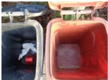
绿港村建闸 303 号垃圾分类正常