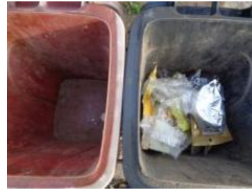
绿湖村湖滨 604 号垃圾分类正常