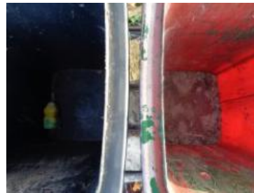
绿湖村湖滨 803 号垃圾分类正常