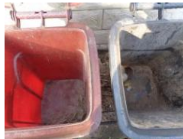
华星村海桥 212 垃圾分类正常