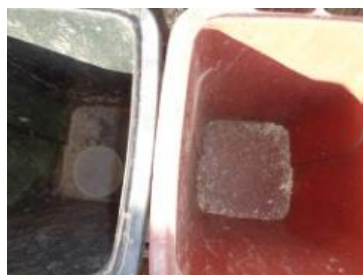
绿港村建闸 302 号垃圾分类正常