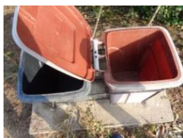
绿园村建三 915 号垃圾分类正常