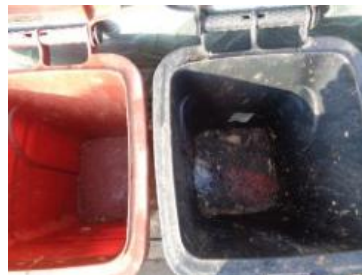
华星村海桥 208 号垃圾分类正常