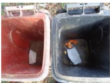
华西村江口 701 号垃圾干湿不分