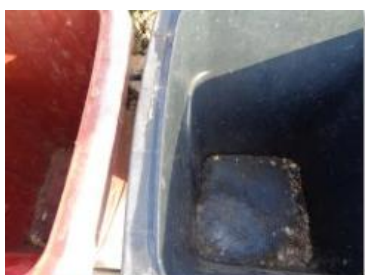
绿园村建三 913 号垃圾分类正常