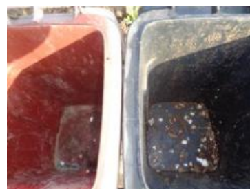
绿园村建三 914 号垃圾分类正常