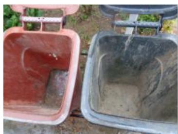
海华新村 53 号垃圾分类正常