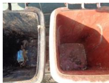
华星村海桥 210 号垃圾分类正常