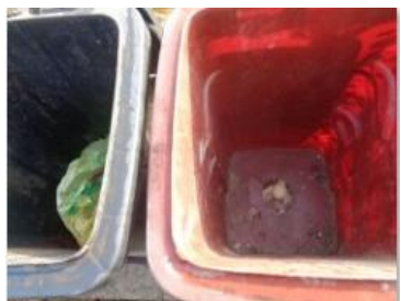
华星村海桥 215 号垃圾分类正常