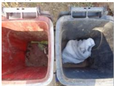
华荣村江口 306 号垃圾分类正常