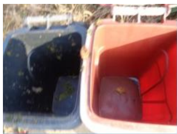
绿园村建三 820 号垃圾分类正常