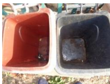
华西村江口 538 号垃圾分类正常