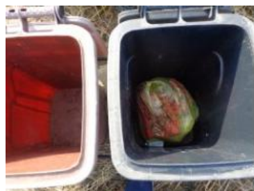
华荣村江口 209 号垃圾分类正常