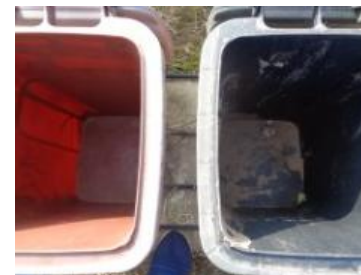
华荣村江口 208 号垃圾分类正常