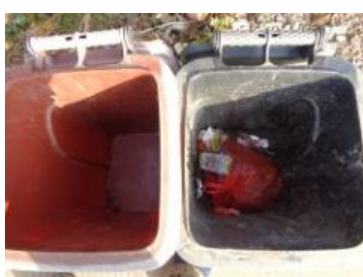
华西村江口 602 号垃圾分类正常