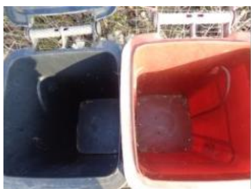
绿园村建三 822 号垃圾分类正常