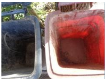
绿湖村湖滨 517 号垃圾分类正常