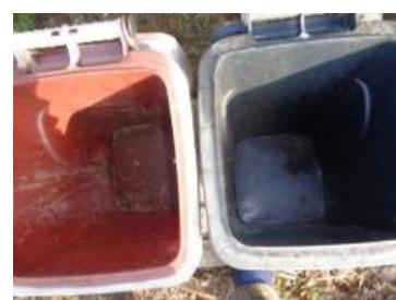
绿园村建三 916 号垃圾分类正常