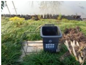
绿港村建闸 301 号缺桶