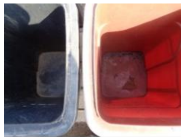
华荣村江口 205 号垃圾分类正常