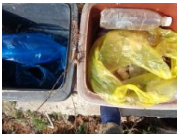
华荣村江口 403 号垃圾干湿不分