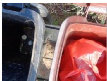
华荣村江口 301 号垃圾分类正常