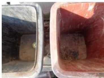
华星村海桥 207 号垃圾分类正常