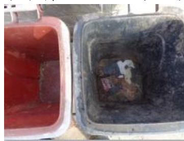
华荣村江口 407 号垃圾分类正常