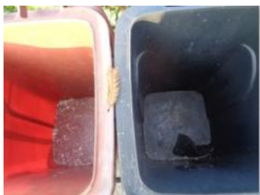
绿港村建闸 131 号垃圾分类正常