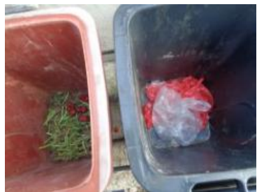
绿港村建闸 121 号垃圾分类正常