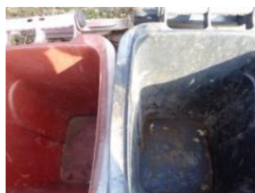
绿园村建三 823 号垃圾分类正常