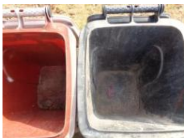
华星村海桥 209 号垃圾分类正常