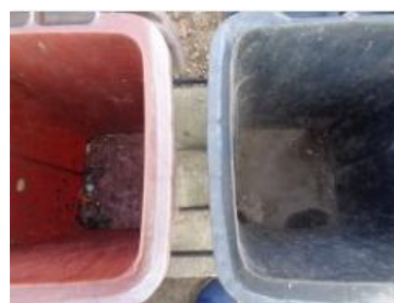
华荣村江口 206 号垃圾分类正常