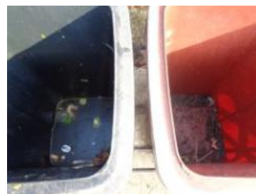
绿园村建三 912 号垃圾分类正常