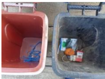
绿港村建闸 104 号垃圾干湿不分