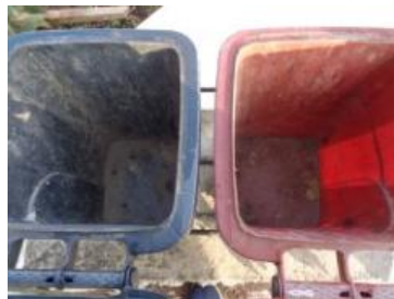
绿湖村湖滨 801 号垃圾分类正常