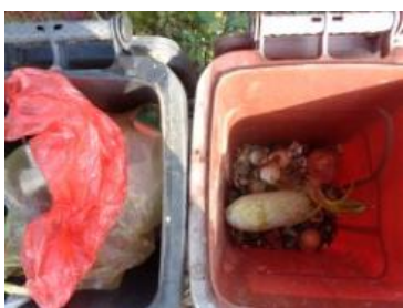
华西村江口 536 号垃圾分类正常