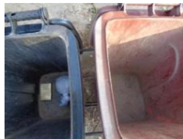
绿湖村湖滨 603 号垃圾分类正常