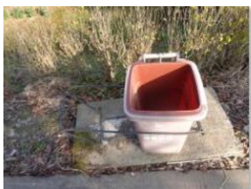
6、华西村 1 处缺桶、2 处未分类投放 华西村江口 519 号缺桶