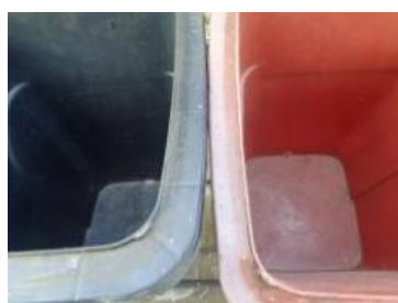
绿港村建闸 103 号垃圾分类正常