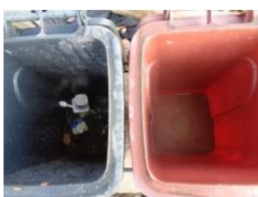
华西村江口 537 号垃圾分类正常