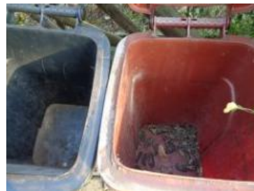
绿港村建闸 304 号垃圾分类正常