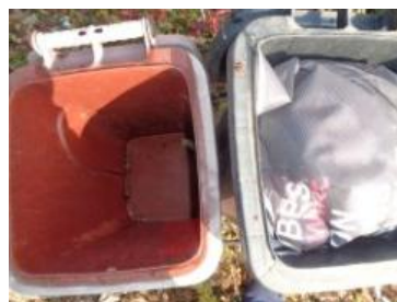
华西村江口 539 号垃圾分类正常