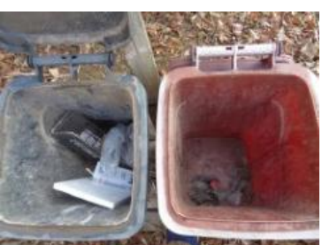
华西村江口 603 号垃圾分类正常