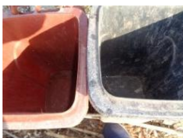
绿园村建三 826 号垃圾分类正常