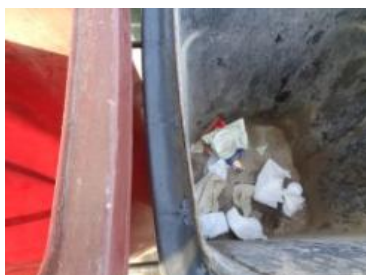
华星村海桥 212 号垃圾分类正常