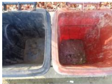
绿湖村湖滨 902 号垃圾分类正常