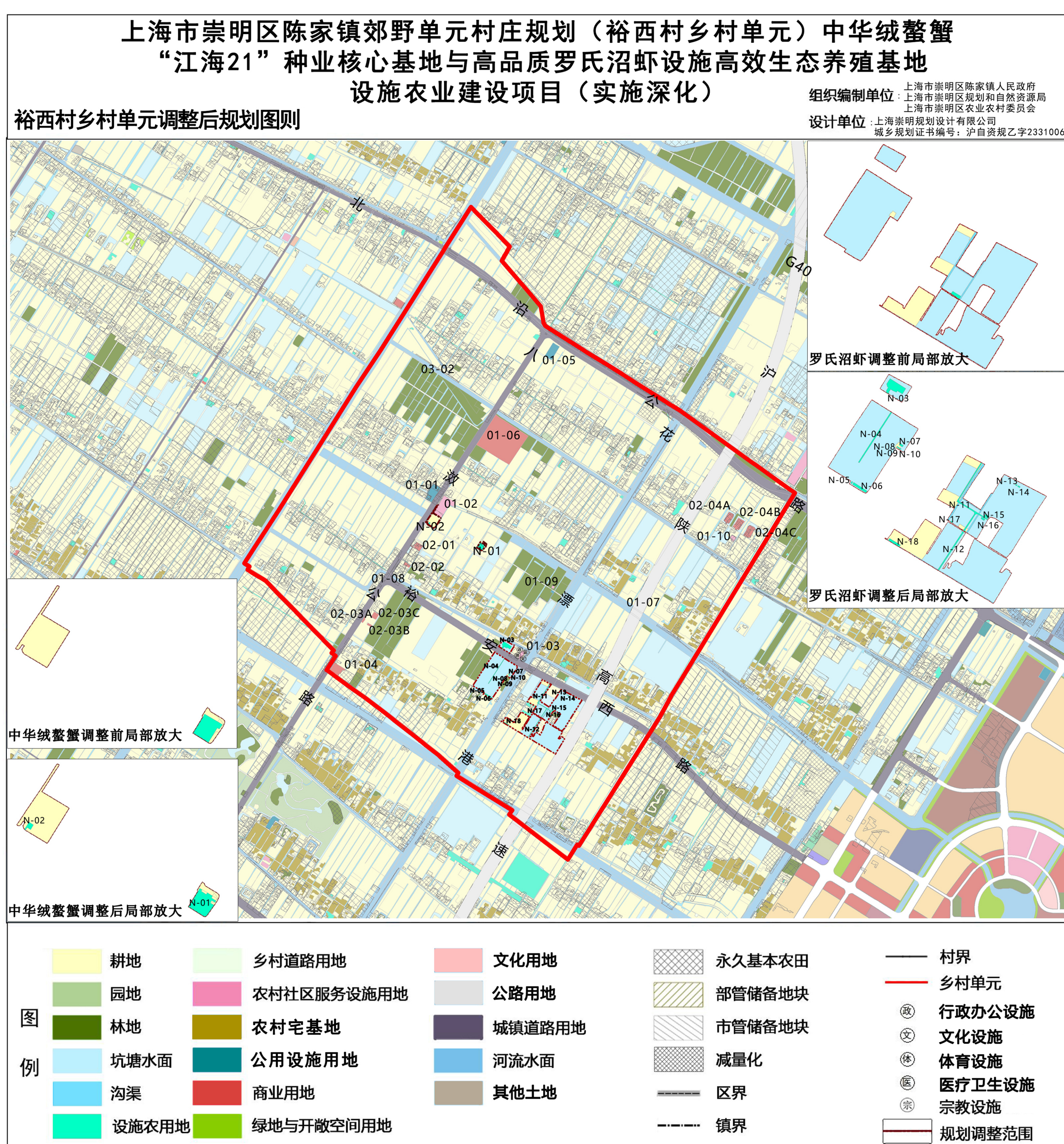
裕西村乡村单元 (CMCJJY12) 原图则